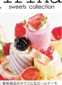
「Irina」看板商品のカラフルなロールケーキ

「SWEETS MAKER」スマートフォンで撮影した写真をプリントして世界に1つのオリジナルケーキやクッキーを、最短翌日に全国にお届けするというオンラインサービス( http://www.sweetmaker.com )である。