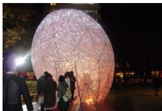
同社制作のイルミネーション

溶接、組立技術に45年以上携わる中積み重ねたノウハウにより、お客様のご要望にきめ細かくお応えしている。主要な製品としては、産業用機械設備用部品製造、医療・食品の部品製造・板金加工、架台などの製缶加工、機械加工、自動車、オートバイなどの金属アプターパーツやホビー商品まで幅広く対応している。現在、横浜本社工場、川崎工場、綾瀬工場と3カ所に工場を有し、