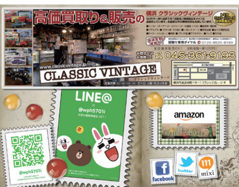
販売だけでなく買取りと下取りも行っている。欲しい商品は下取りで安くGET!

はじめ、さまざまなジャンルの商品を取扱うお店からスタートした。ちよと、コレクターと呼ばれる、関連グッズを買い集めて揃えるファンが増え始めた時代である。また当初は、こういったホビー関連商品を扱うお店も少なく、同店のオーナーである清水夫妻もおもちゃのコレクターをしており、来店されるコレクターの方々との秘蔵コレクションの方々と話が始まると、つい話に火が付き盛り上がり、つい話にしまふこともよくあるそう。