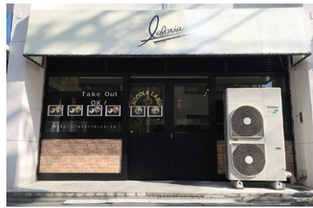
「ロリオヌードルラボ」1号店。大田区北千束、03・3726・5515

テイクシステム(目黒区洗足、大岩義丈社長、03・5722・4203、 http://www.take-sys.co.jp )は、昭和58年の創業以来、F Aメカニカルの電機、機械設計、製作を通じ、国内製造業の工場オートメーション化に貢献してきた。1つの業界に囚われず、自動車・半導体・一般缶・建設など多彩な業界で活躍し、現在は世界規模に拡大したラーメン市場の需要を取りこむために、全自動茹で麺機(HIMAJIN)の開発に力を入れている。 今年4月に発生した熊本地震の際も、被災地で1000杯以上の炊き出しを行った実績を持つこの新製品が、型化に成功し導入された1号店「ロリオヌードルラボ」が