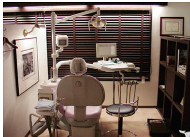
安心して治療を受けられる半個室の診療室

る。ホームページの施工実績には誰もが一度は利用したことのある現場写真が並んでいるので、ぜひ一度ご覧いただきたい。また、「創業より、技の表現と夢の実現」をスローガンに、人から人へ技能と技術を継承してきま