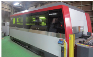
最新のファイバーレーザー

誕生日や記念日のお祝いだけでなく、結婚式のプチギフトや自社のロゴを入れて会社のイベントの贈答品にもお勧めの注目商品だ。気持ちが伝わる世界に1つだけのスイーツと、とびきりのサプライズをプレゼントしてみたいかがでしょうか。