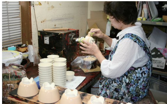
塗りの工程は、職人が一つひとつ手作業で行っている