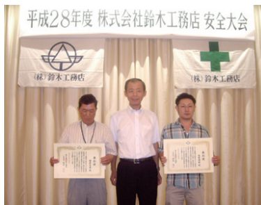
随時社員の表彰を行い、技術向上や安全確認への意識づけを図る

現場写真が並んでいるので、ぜひ一度ご覧いただきたい。また、「創業より、技の表現と夢の実現」をスローガンに、人から人へ技能と技術を継承してきました。これからの、安全で暮らしやすい社会を創るためにも、ものづくりの「人から人へ」の技能と技術を継承してきま