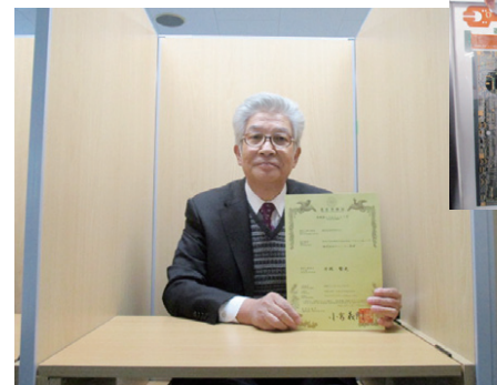
同社がプリント基板の技術をもとに開発した「対面式個別ブース」

平成12年に本社ビルを建てた際、空きスペースを利用して学習塾「慧友」( http://www.keiyu-juku.com/ )の経営を始めた。今では、幼児コースから大学受験コース、英検コースまで、幅広い受講生に対応している。 同塾の指導方針は、通常の教科指導はもちろん、もっとも力を入れている点は「勉強のやり方」そのものを教えていることである。部活動などで忙しい子どもにも、何とか時間を見つけて学習を進められるよう習慣づけるコツ