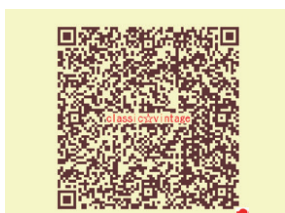
サイトへの接続は、QRコードからお願いいたします。

最近では、今の時代に合わせておもちゃのジャンルも広がり、ミニ四駆やデイズ二一関係各種アニメキャラクターのグッズも店頭に並んでいる。最近ではあまりお目にかからなくなった、東京マルイから出ている各種ガンなども取扱うようになった。