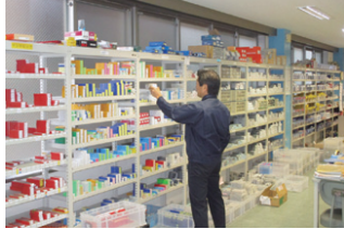
業界屈指の豊富な在庫量

また、ヨーロッパなど海外のメーカーと協力して開発した「IGブランド」工具が、同社のイチオシ商品だ。選び抜かれたメーカーにより高品質の材料、高性能の機械を用いて製作され、価格は抑えつつも確かな品質で、お客様からの信頼も非常に厚い。