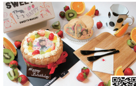
写真を入れたオリジナルスイーツでHappyなサプライズを演出! 「SWEETS MAKER」のご注文・詳細はアプリをダウンロード⇒

誕生日や記念日のお祝いだけでなく、結婚式のプチギフトや自社のロゴを入れて会社のイベントの贈答品にもお勧めの注目商品だ。気持ちが伝わる世界に1つだけのスイーツと、とびきりのサプライズをプレゼントしてみたいかがでしょうか。