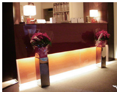
来院される患者様にプレッシャーを感じさせない明るい受付